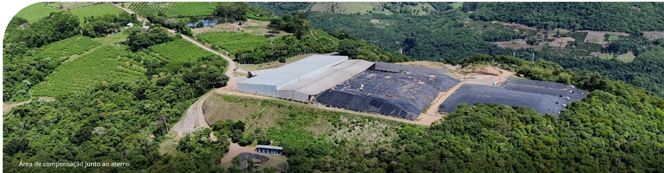
Área de compensação junto ao aterro.

A Fundação Proamb reconhece a importância da conservação da biodiversidade e implementa medidas para mitigar os impactos de suas atividades nos ecossistemas locais.