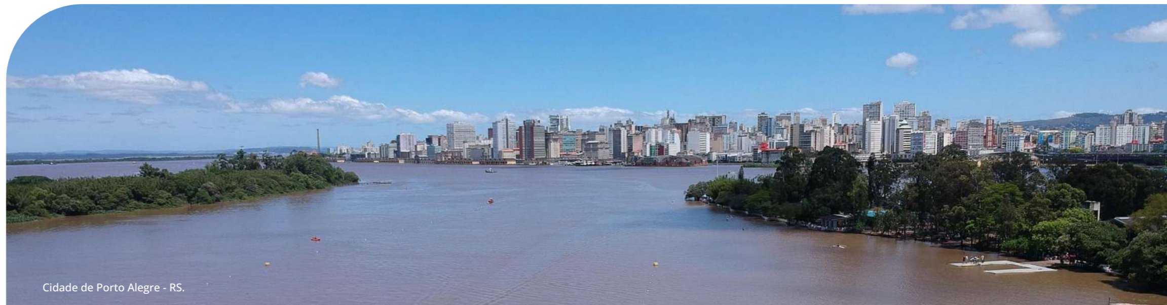
Cidade de Porto Alegre - RS.

A Fundação Proamb atende uma ampla gama de setores industriais e outros segmentos no Rio Grande do Sul. Nossa carteira de clientes ativos incluiu, entre outros: