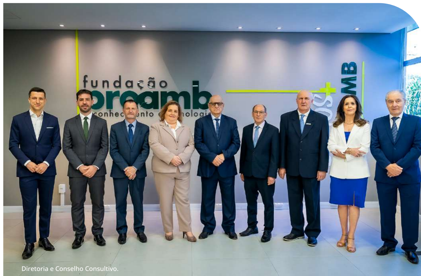
Diretoria e Conselho Consultivo.

de sua missão e a responsabilidade perante seus diversos stakeholders . A governança da Proamb é composta por diferentes órgãos com papéis definidos, garantindo um sistema de freios e contrapesos e a tomada de decisão equilibrada e eficaz: