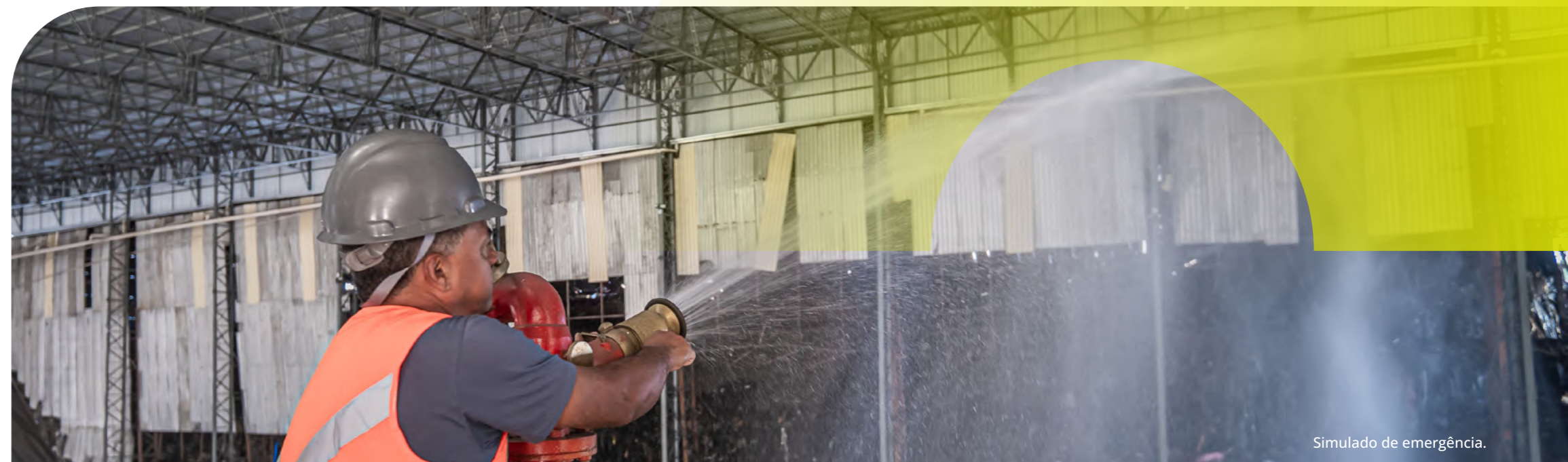
Simulado de emergência.

Conforme detalhado na seção de Ética e Integridade, a organização mantém políticas robustas e canais de denúncia também são utilizados para a prevenção e o combate do assédio moral e sexual. Não foram registradas denúncias dessa natureza no período.