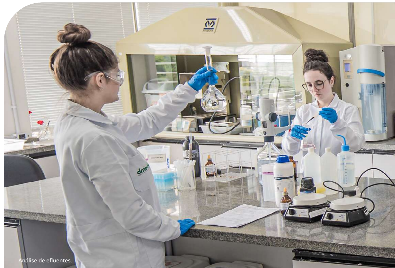
Análise de efluentes.

conforme exigências legais e diretrizes ambientais. Esses programas seguem planos de monitoramento aprovados pelos órgãos ambientais competentes.