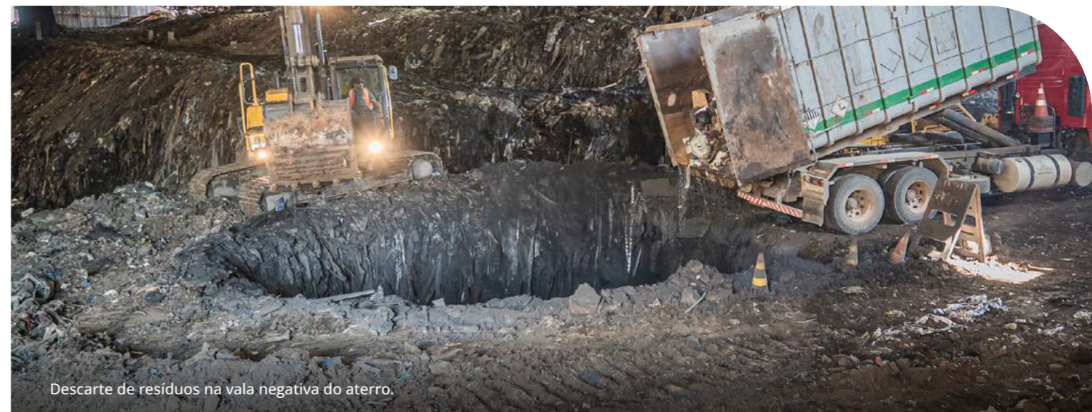
Descarte de resíduos na vala negativa do aterro.

Localizado em Pinto Bandeira é responsável pela destinação final ambientalmente adequada de resíduos sólidos industriais perigosos (Classe I) e não perigosos (Classe IIA). A operação é referência em proteção ambiental, conduzida em conformidade com normas rigorosas e