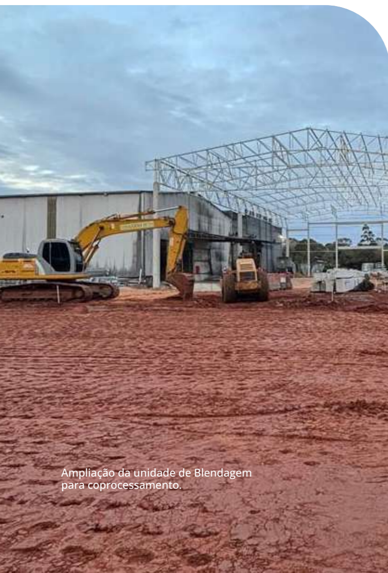
Ampliação da unidade de Blendagem para coprocessamento.

No biênio 2024–2025, a Proamb consolidou um ciclo relevante de expansão de suas operações, aliado ao aumento consistente da eficiência operacional em suas unidades de negócio.