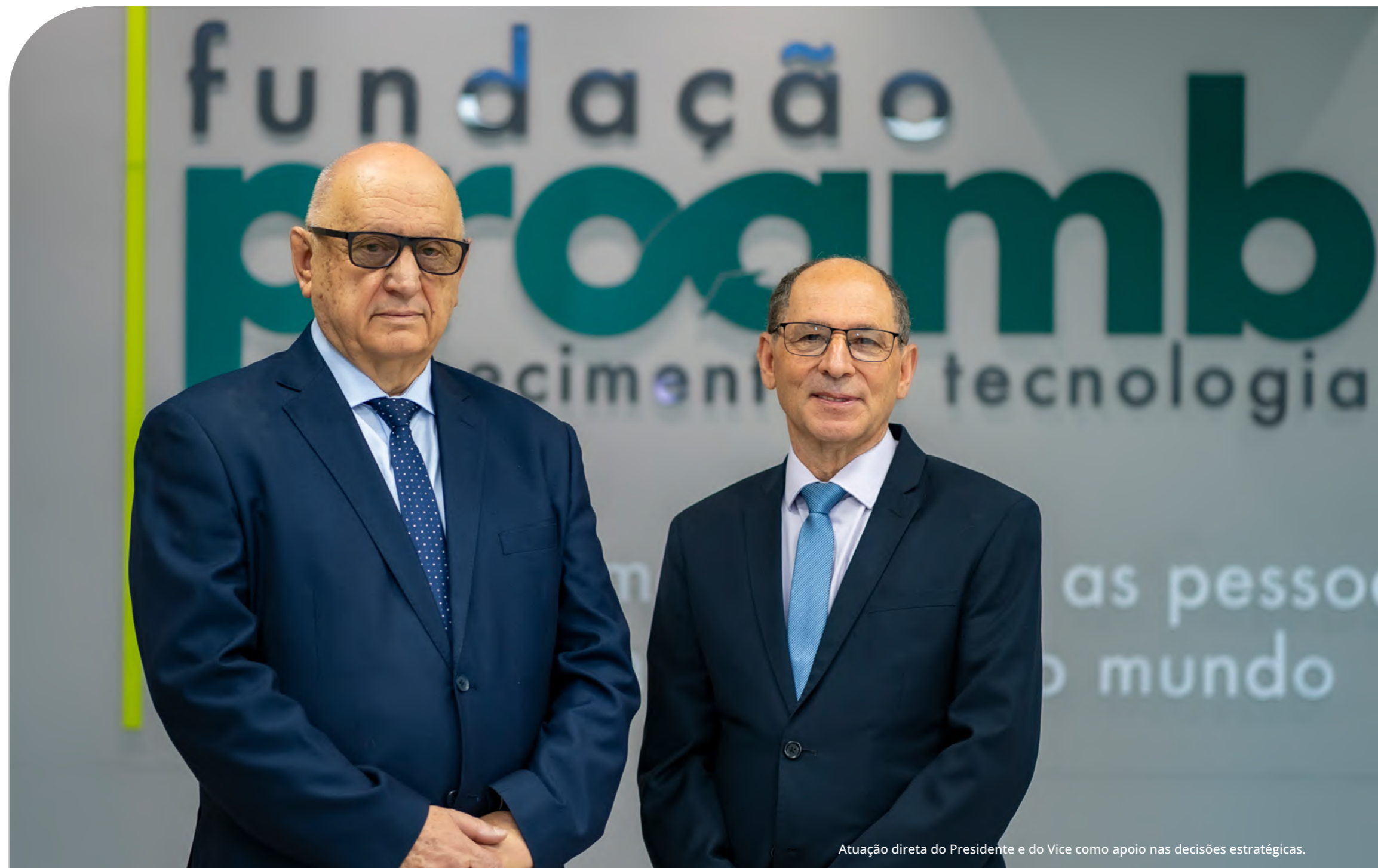
Atuação direta do Presidente e do Vice como apoio nas decisões estratégicas.

Os dados financeiros específicos, como receitas, custos e investimentos, são reportados de forma completa e auditada na prestação de contas anual encaminhada ao Ministério Público, conforme previsto na legislação aplicável.