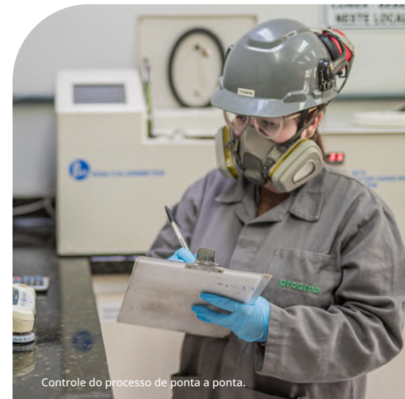
Controle do processo de ponta a ponta.

operacional, segurança da informação, conformidade legal e as auditorias internas e externas (implícitas na prestação de contas ao Ministério Público) são componentes importantes da nossa abordagem à gestão de riscos. A supervisão exercida pelo Conselho Curador e as deliberações do Conselho Deliberativo também desempenham papel relevante na supervisão dos riscos estratégicos e financeiros da Fundação.