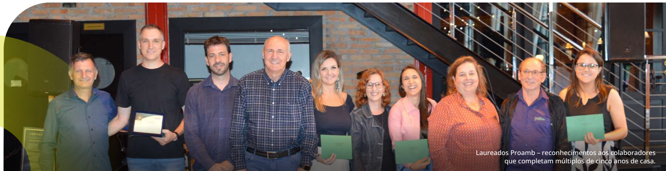
Laureados Proamb – reconhecimentos aos colaboradores que completam múltiplos de cinco anos de casa.

Priorizamos o preenchimento de vagas com colaboradores internos capacitados, avaliando competências e qualificações. Caso a vaga não seja preenchida através de movimento interno na área, é divulgada para toda a empresa com prazos e pré-requisitos claros. Estagiários podem se candidatar após seis meses de atuação. Nossa política de promoções visa o crescimento profissional estruturado, a valorização e o reconhecimento do desempenho, com critérios claros e transparentes, fomentando o desenvolvimento interno, a melhoria do clima organizacional e a retenção de talentos.