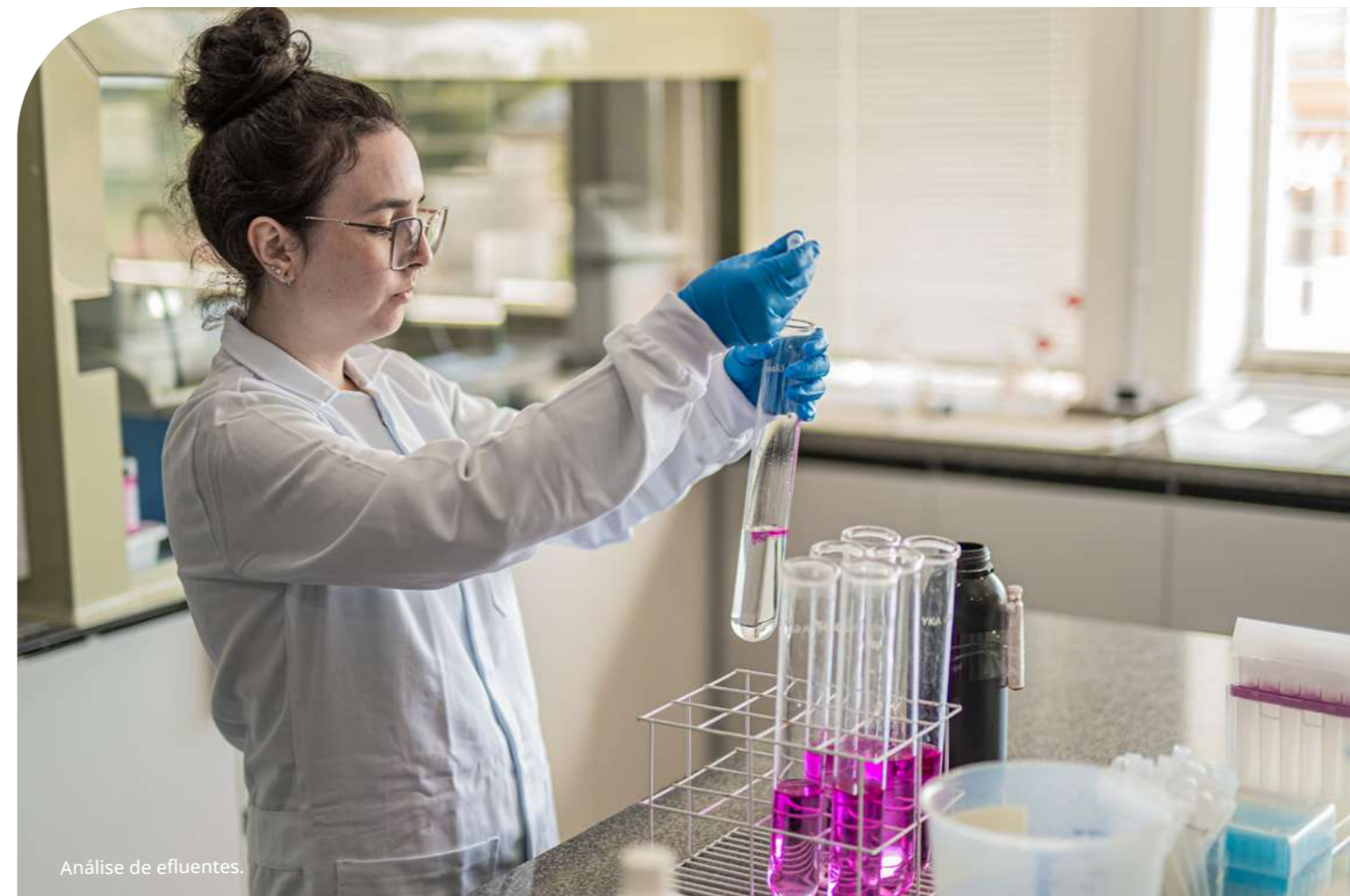
Análise de efluentes.

processos, metodologias e soluções técnicas com foco em segurança, conformidade regulatória e interesse público. No eixo do Combustível Derivado de Resíduos (CDR), em 2025 foram realizados testes operacionais do blend de 25 milímetros, com evolução para a fase de negociação com a cimenteira e previsão de implementação em 2027, reforçando a maturação tecnológica da solução, que tem como objetivo ampliar a descarbonização da indústria do cimento. Em paralelo, a Proamb fortaleceu sua capacidade de captação de crédito para inovação e expansão e realizou melhorias de processo e estrutura, com captação de 8 milhões de reais via BNDES para expansão fabril da Unidade de Blendagem para Coprocessamento e 10 milhões de reais via Badesul destinados à modernização operacional, ampliação de capacidade e aprimoramentos de infraestrutura, complementados por recursos próprios. Esses investimentos sustentam o aprimoramento