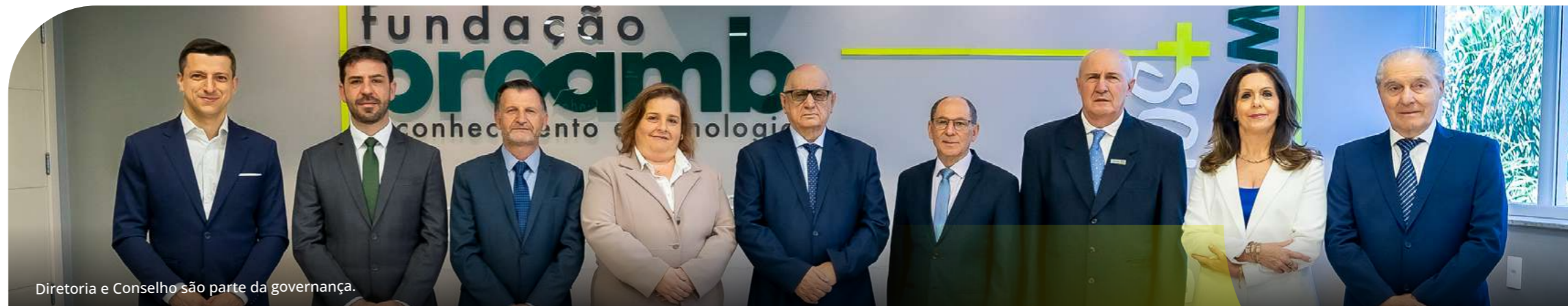
Diretoria e Conselho são parte da governança.

No biênio 2024-2025, os resultados indicam uma trajetória de consolidação e amadurecimento da gestão ESG da Fundação Proamb, com avanços relevantes em eficiência ambiental e fortalecimento de mecanismos de governança, ao mesmo tempo em que evidenciam temas sociais prioritários para a agenda de melhoria contínua.