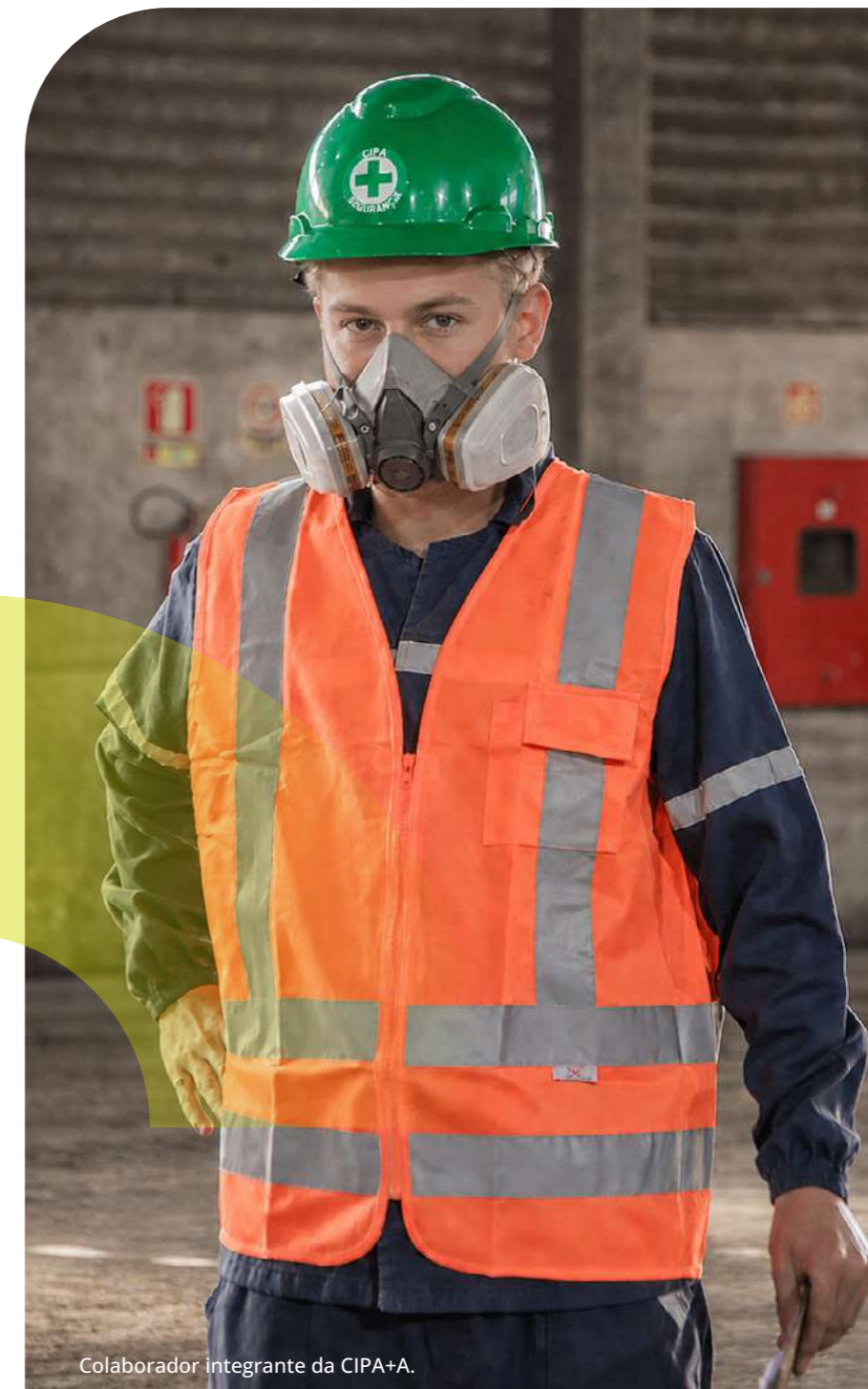
Colaborador integrante da CIPA+A.

Como evolução, a Proamb reforçou controles preventivos e o acompanhamento das ações corretivas e preventivas.