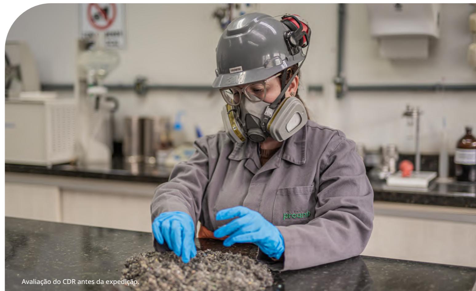
Avaliação do CDR antes da expedição.

amostragem, químicos e microbiológicos; a ISO9001:2015 , voltada à gestão da qualidade no processamento de resíduos de Classe I e II; e a ISO14001:2015 , que confirma práticas sustentáveis na disposição de resíduos sólidos.