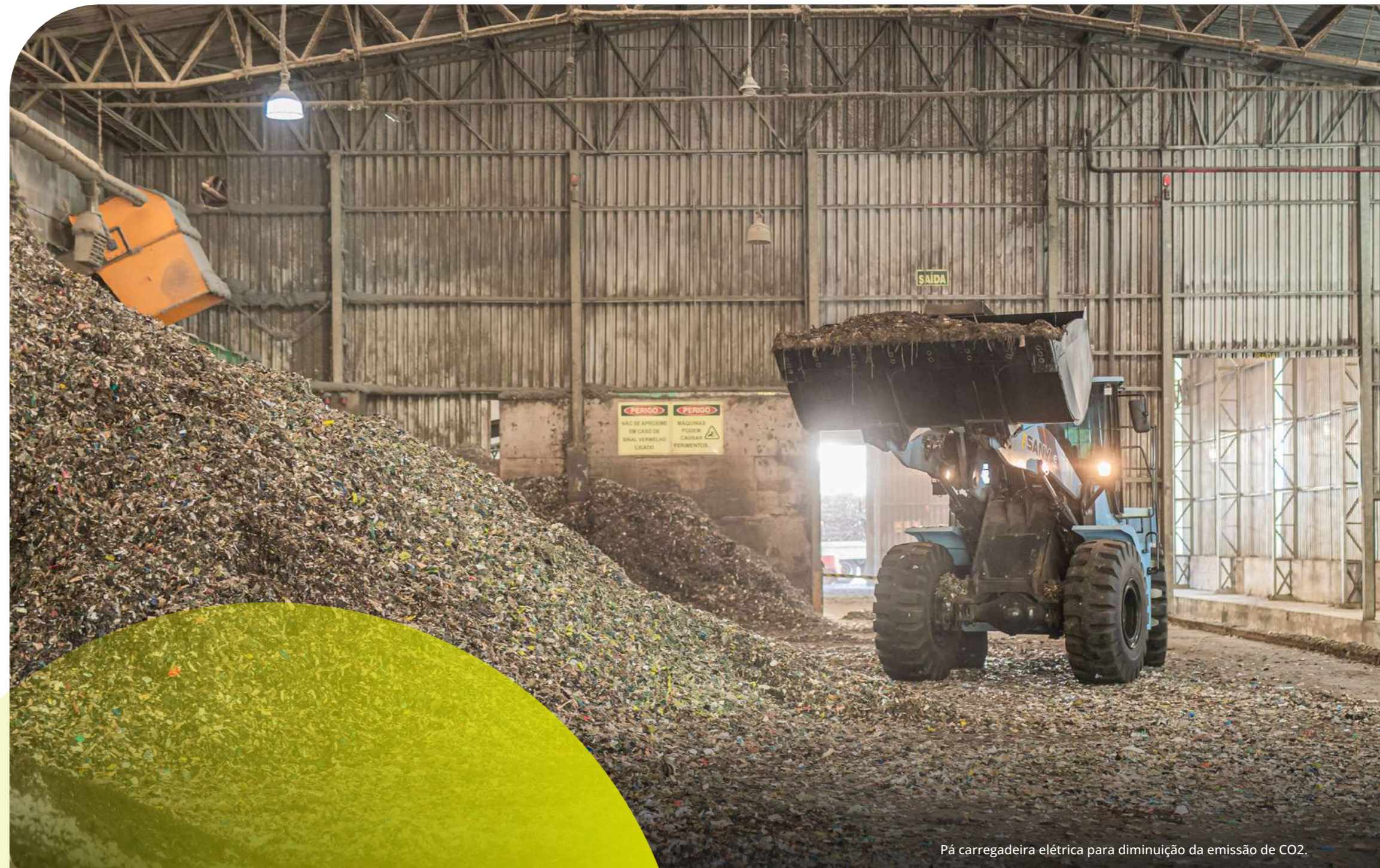
Pá carregadeira elétrica para diminuição da emissão de CO 2 .

Conforme certificado pela gestora contratada de energia renovável Ludfor Energia , a energia elétrica consumida pela Unidade de Blendagem é proveniente de fonte limpa e totalmente renovável, oriunda de usinas de fontes eólica, solar, biomassa, Pequena Central Hidrelétrica (PCH) e Central Geradora Hidrelétrica (CGH), com fornecimento registrado desde janeiro de 2020.