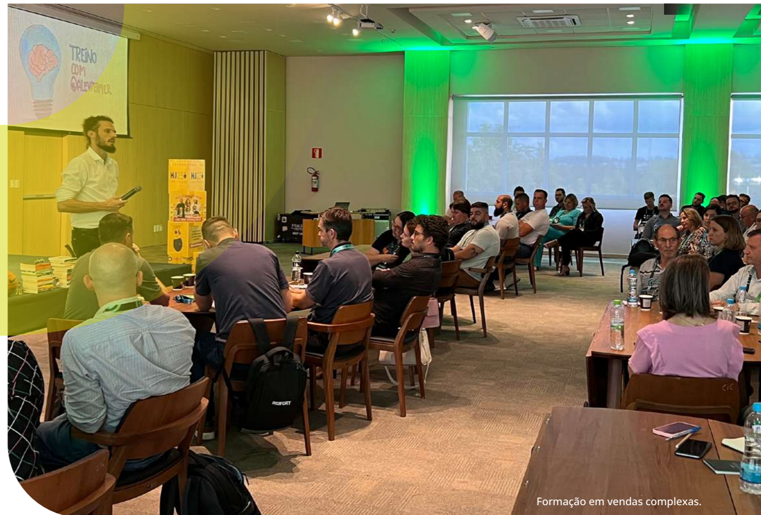
Formação em vendas complexas.

No ciclo de 2024 , destacaram-se formações orientadas a empreendedorismo, inovação e liderança, como Intraempreendedorismo e Visão de Futuro com 72 horas e 12 participantes , Liderança Ágil com 16 horas e 20 participantes , participação na HJ Conference com 48 horas e 15 participantes , e o MBA em Neuroestratégia e Pensamento Transversal com 360 horas, com subsídio parcial para 5 colaboradores . Em 2025 , os destaques estiveram concentrados em qualificação para sistemas de gestão, desenvolvimento comercial e evolução digital, incluindo, HJ Conference