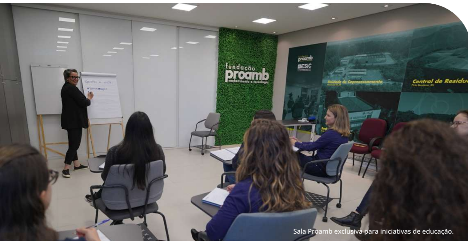
Sala Proamb exclusiva para iniciativas de educação.

Complexas, Transporte de Cargas Perigosas e Ações de Emergência, Licenciamento e Infração Administrativa Ambiental e o MBA – Master em Neuroestratégia e o Pensamento Transversal , Turma 4, reforçando o compromisso com o desenvolvimento de competências técnicas e estratégicas alinhadas às demandas do setor.