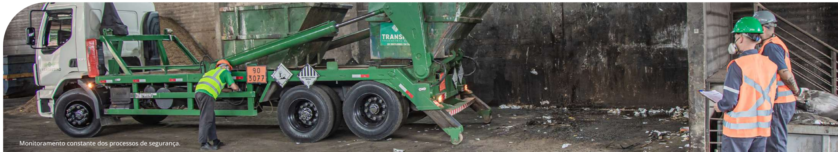
Monitoramento constante dos processos de segurança.