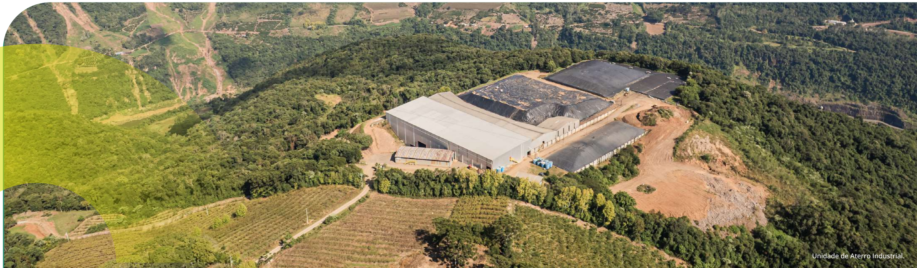
Unidade de Aterro Industrial.