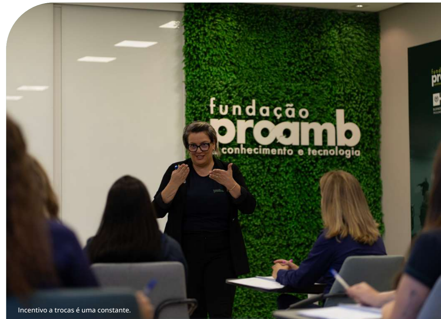
Incentivo a trocas é uma constante.

A identificação e priorização dos temas materiais aqui reportados seguiram as orientações da Norma GRI 3: Temas Materiais 2021. O processo envolveu a análise do contexto de sustentabilidade da Fundação Proamb, a consideração dos impactos econômicos, ambientais e sociais de nossas atividades e o levantamento das expectativas e interesses de nossos principais stakeholders . A Análise SWOT, detalhada na seção de Estratégia de Sustentabilidade, também subsidiou a identificação de conteúdos relevantes. Os temas materiais refletem os impactos mais significativos da organização e aqueles que influenciam as avaliações e decisões dos nossos públicos de relacionamento.