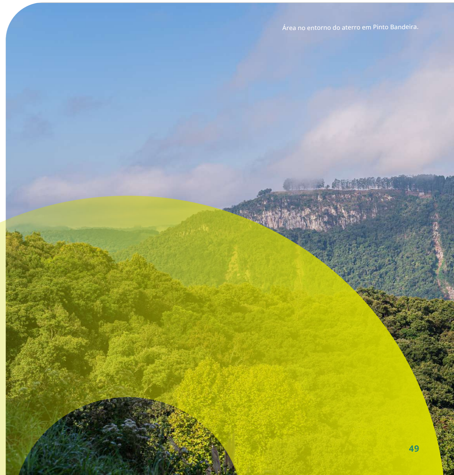
Área no entorno do aterro em Pinto Bandeira.

SWOT (Strengths, Weaknesses, Opportunities, Threats): Ferramenta de análise estratégica que avalia Forças, Fraquezas, Oportunidades e Ameaças de uma organização.