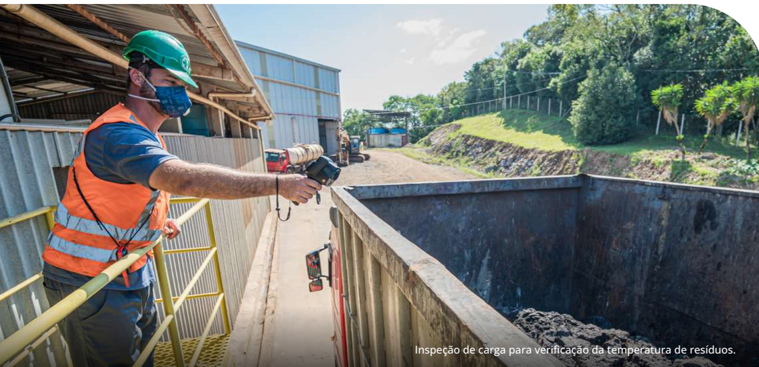
Inspeção de carga para verificação da temperatura de resíduos.

ambientais, rastreabilidade completa e a busca contínua por tecnologias mais limpas e eficientes para tratamento e destinação. Em 2024 , a Proamb conduziu projetos completos de gestão e destinação de resíduos para 18 empresas , assegurando a rastreabilidade e a destinação ambientalmente segura dos materiais.