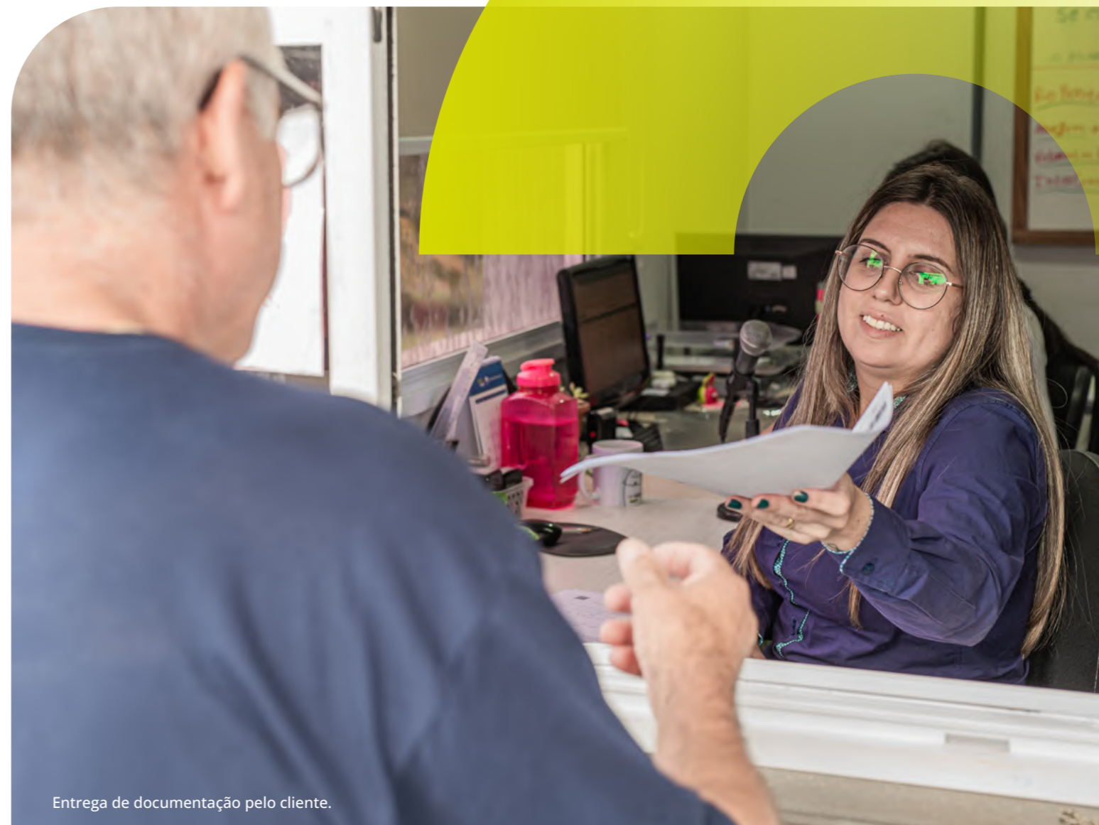
Entrega de documentação pelo cliente.

Membros instituidores e beneméritos: Empresas e indivíduos que participam da governança e apoiam na perenidade da Fundação.