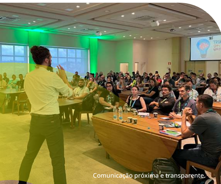
Comunicação próxima e transparente.

Através desses canais, buscamos informar, ouvir e responder às demandas e expectativas de nossos stakeholders , fortalecendo relações de confiança e colaboração mútua.