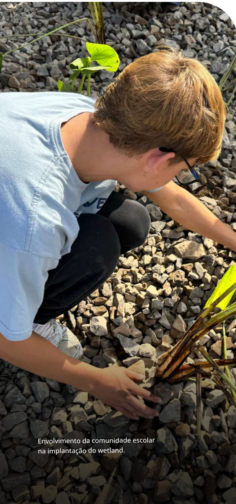
Envolvimento da comunidade escolar na implantação do wetland.

Como resultado, reforça sua estratégia de crescimento baseada em inovação, parcerias e acesso a recursos estruturantes, ampliando sua capacidade de investimento sem pressão sobre o capital próprio e potencializando a geração de valor ambiental e econômico.