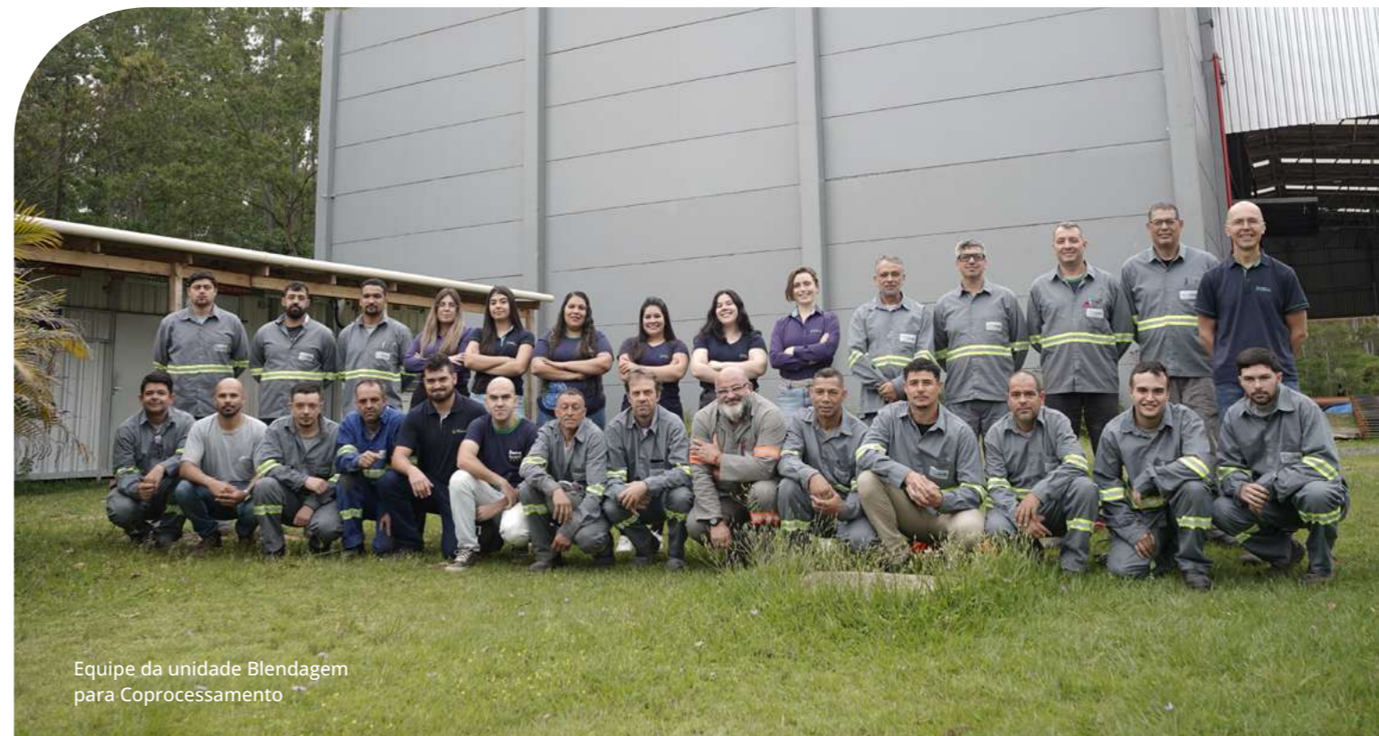
Equipe da unidade Blendagem para Coprocessamento

conformidade com a legislação vigente e com as melhores práticas do setor. Um pilar fundamental da nossa constituição e operação é o compromisso de que toda a receita gerada por nossas atividades seja integralmente reinvestida na Fundação, reforçando nossa missão e capacidade de atuação em prol da sustentabilidade.