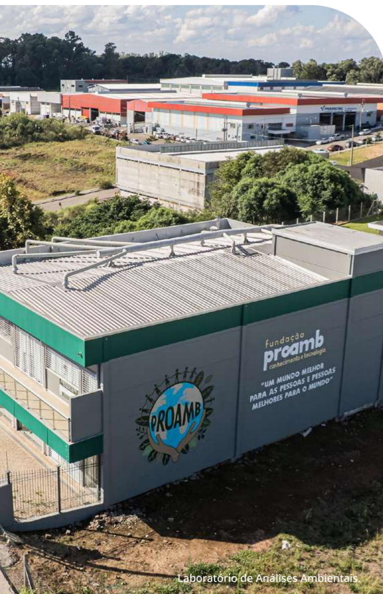
Laboratório de Análises Ambientais

A estratégia de sustentabilidade da Proamb está intrinsecamente ligada à sua missão e visão de futuro. Buscamos ser um agente de transformação, promovendo soluções ambientais que atendam às exigências legais e contribuam efetivamente para o desenvolvimento equilibrado e sustentável. Nosso foco na geração de conhecimento e tecnologia para soluções ambientais é um diferencial que impulsiona a capacidade de inovar e de oferecer serviços de vanguarda.