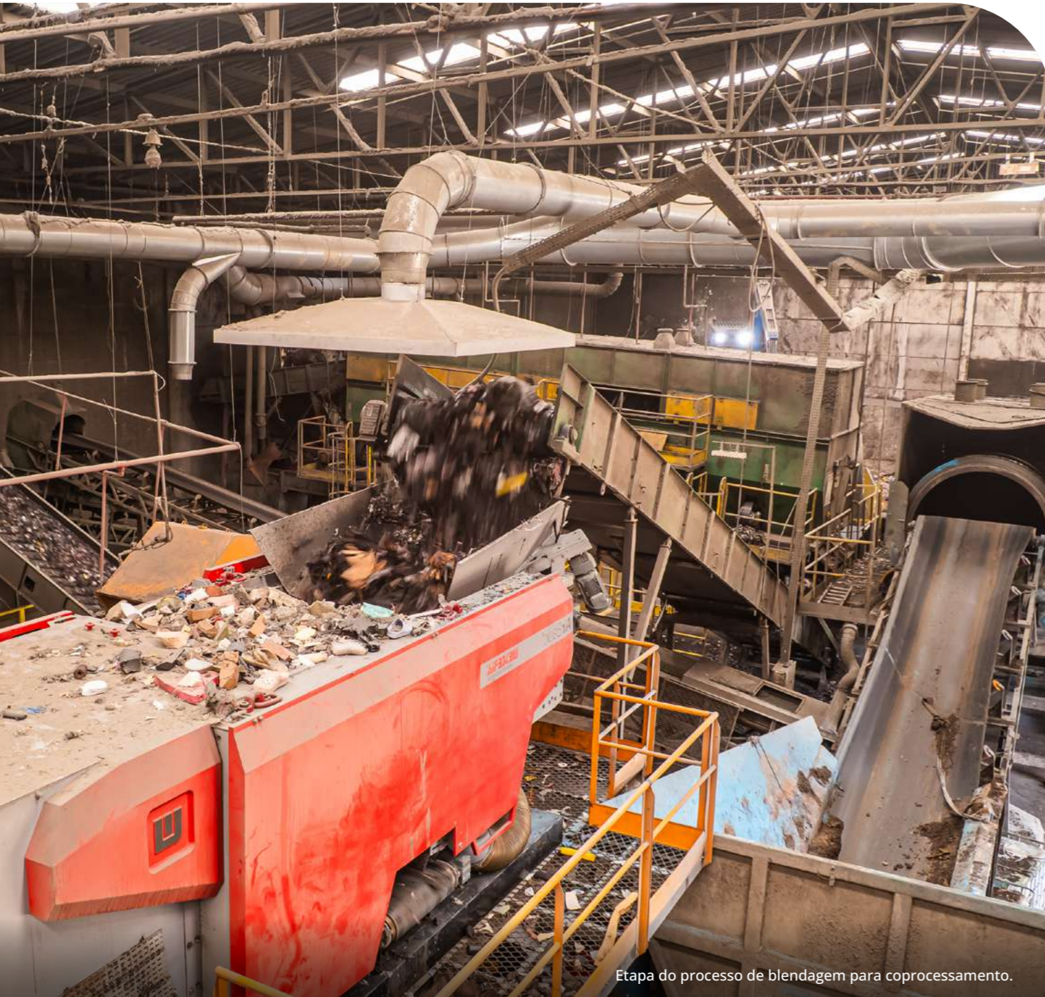
Etapa do processo de blendagem para coprocessamento.