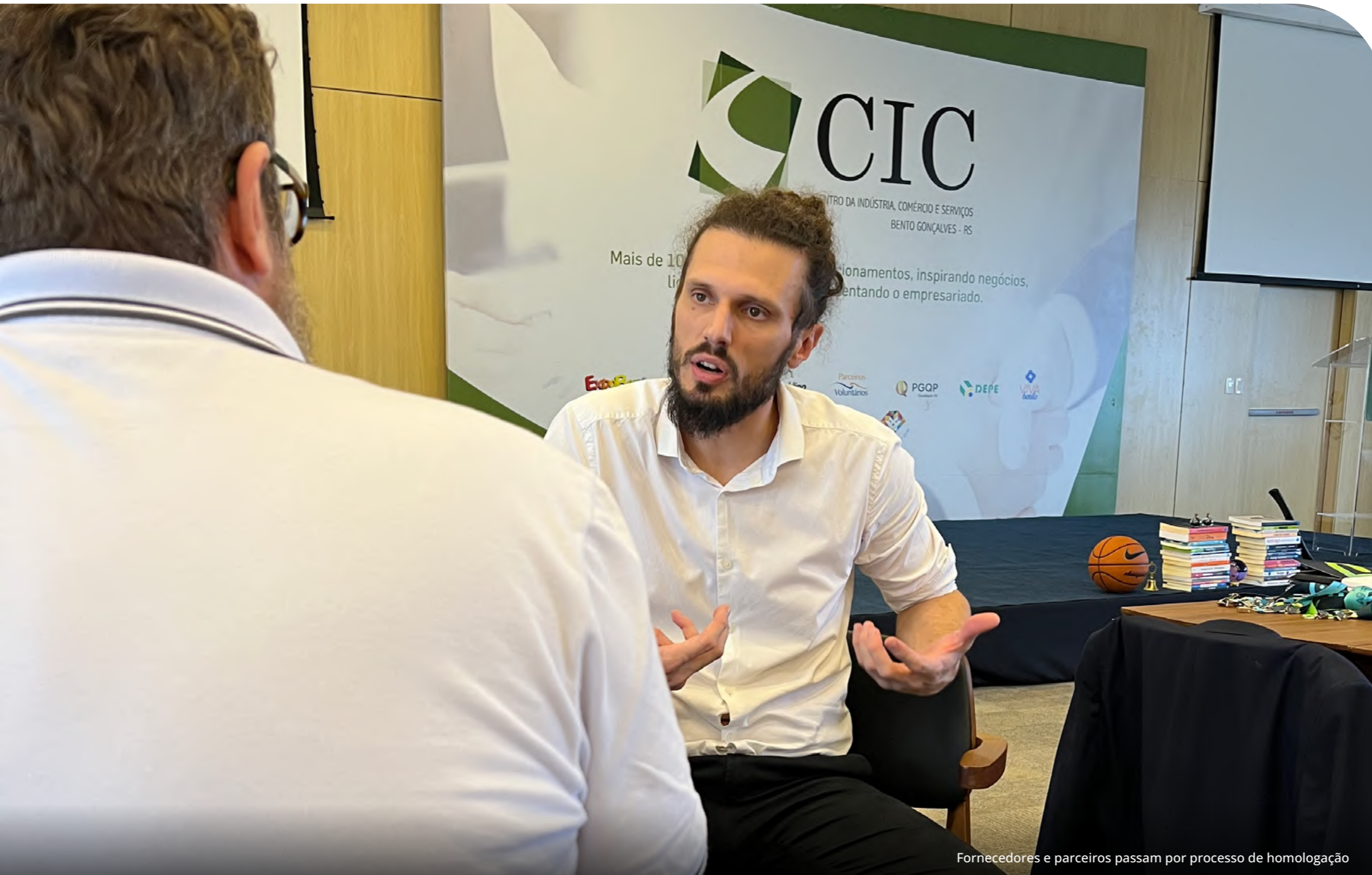
Fornecedores e parceiros passam por processo de homologação